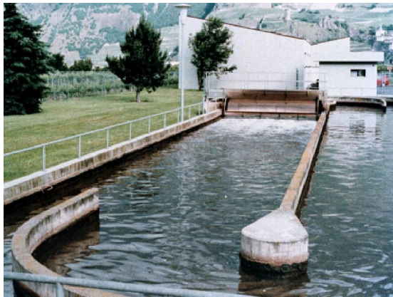
Рис.4. Постоянное использование BioRemove 4200