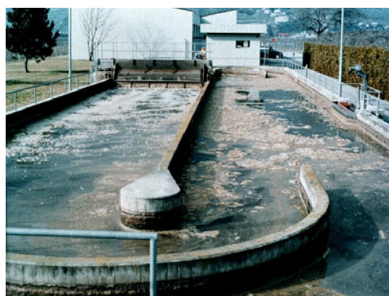
Рис. 3. Во время использования BioRemove 4200 с пониженной пеной