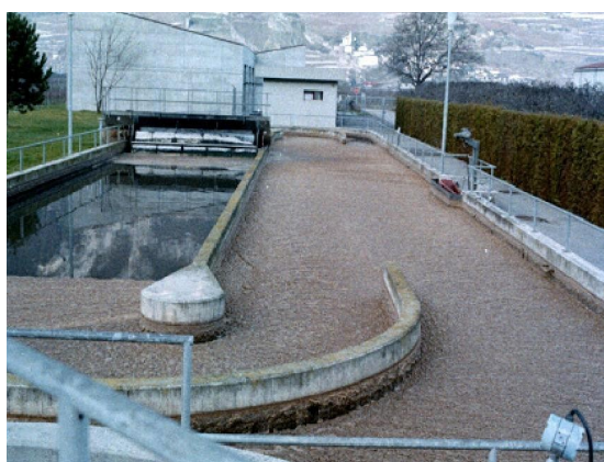
Рис. 2. Перед началом использования поверхность с густой пеной

BioRemove 4200 является эффективным решением для уничтожения жира в городских сточных водах. Очистные сооружения испытывали интенсивную нагрузку жиром, который охватывал большую часть площади аэротенка с жирной пеной. Очистные начали программу с BioRemove 4200, который был разработан, чтобы увеличить способность микробного сообщества деградировать жиры. С регулярным использованием более чем несколько недель BioRemove 4200 деградировал жиры и устранил всю пену на поверхности.